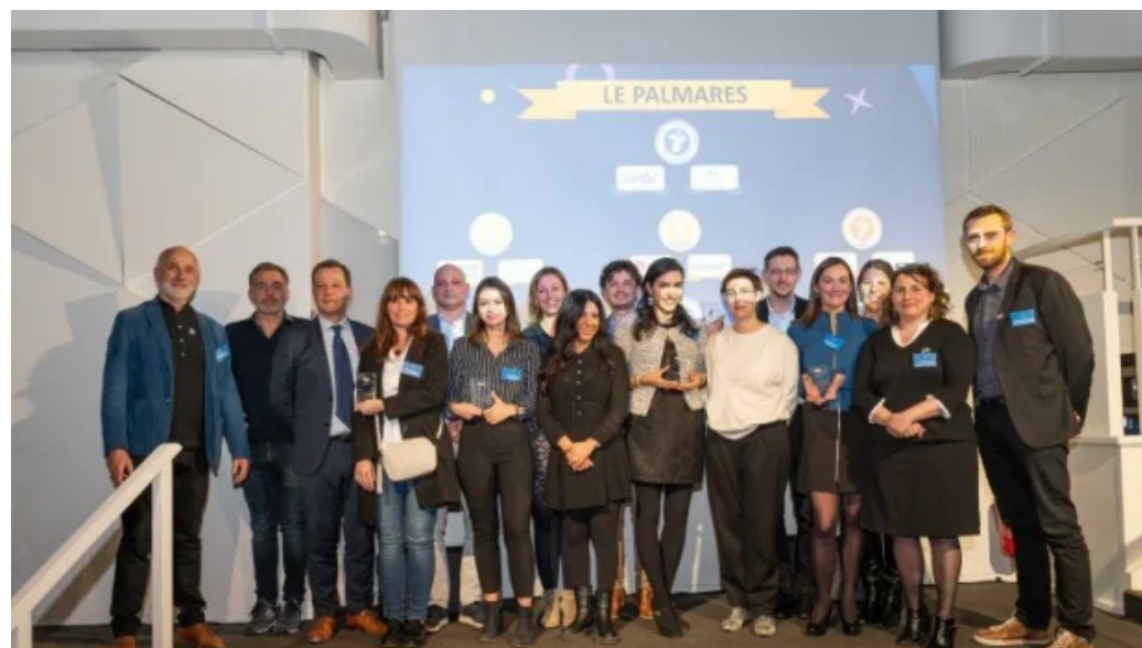
Remise des Trophées EdTech de la formation professionnelle : le palmarès 2022

Associés à des partenaires de formation, My-Serious-Game, Trésorium, 3E Innovation, Cantoo, Kalyzée et Dokki.app se sont distingués lors de la première édition du concours initié par l'association EdTech France. Découvrez les photos de la cérémonie.